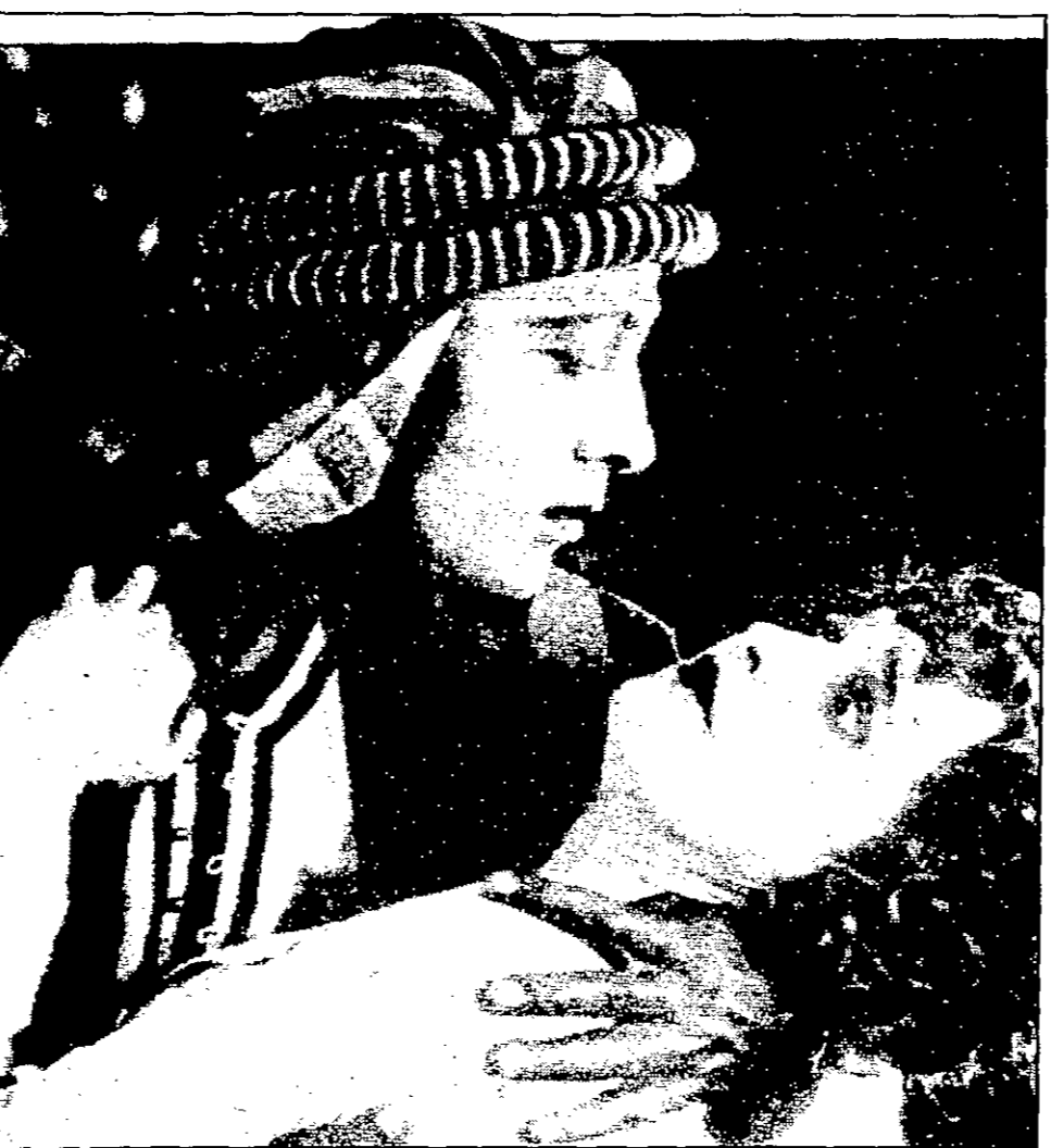
روائع فيلم «الشيخ» عام 1921